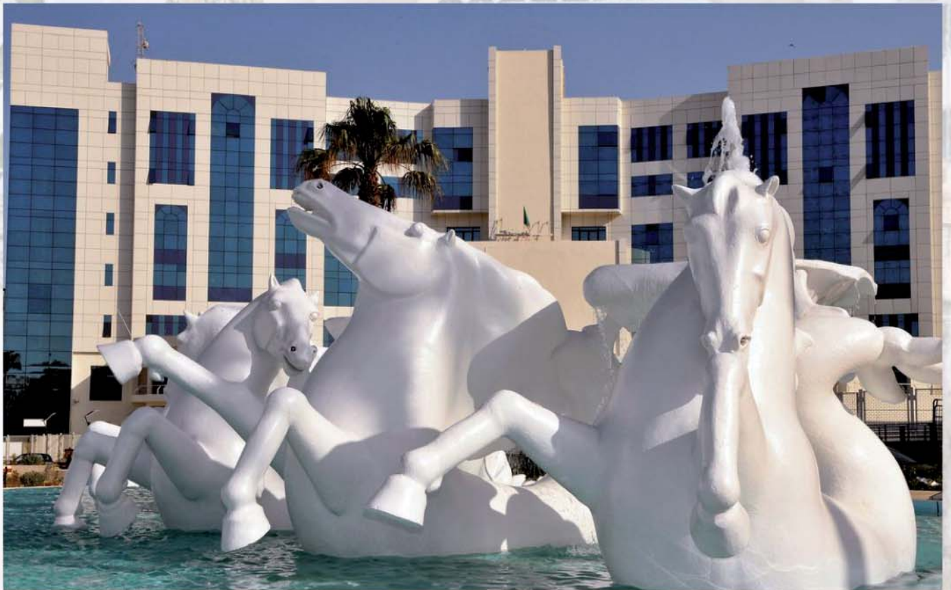
Les Chevaux du Soleil (Alger)

2 ème Congrès de Médecine Physique et de Réadaptation 04 et 05 Juin 2011 - Alger - Institut de formation Sonelgaz de Benaknoun